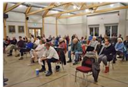
With limited seating due to pandemic guidelines, many viewers watched the debate online.